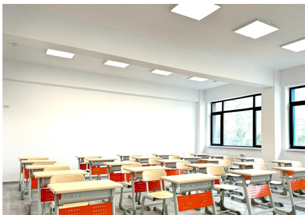
Sală de clasă

Întreg complexul școlar a fost realizat la standarde europene, pe o suprafață de aproximativ 29.500 mp și aici funcționează nivelul preșcolar, primar și gimnazial. În prezent, în școală studiază aproximativ 1500 elevi, iar la grădiniță sunt 350 de preșcolari.